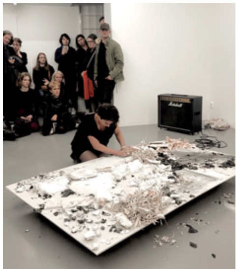
Intervention © Anastasia Ax (Klicka på bilden för hög upplösning)