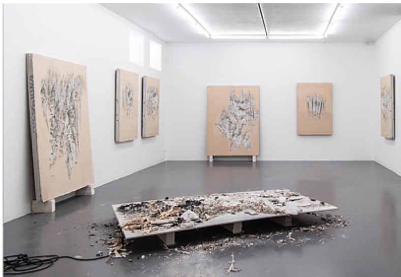
Utställningsvy © Anastasia Ax (Klicka på bilden för hög upplösning)

Anastasia Ax utställning domineras av tjocka gipsskivor som inkläts med sprött rosa papper, seriellt upphängda på galleriets väggar. Gipsobjekten har utsatts för våldsamma ingrepp som utförts med morakniv. På nära håll framstår dessa ingrepp som sensuella snäckformer eller om man så vill som oläcka sår. Men backar man en aning och betraktar verken från ett längre avstånd uppenbarar sig djävulsformationer.